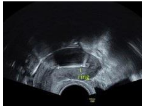
Abbildung 3: Kyleena – sagittale Ebene (2D Bild