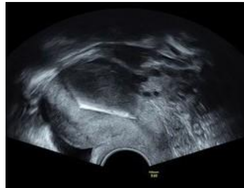
Abbildung 3: Mirena – sagittale Ebene (2D Bild)

Bitte informieren Sie sich zur Unterscheidung von Mirena, Jaydess und Kyleena von anderen intrauterinen Verhütungsmethoden anderer Anbieter auf der Website dieser Anbieter und/oder auf der Website des BfArM ( http://www.bfarm.de/schulungsmaterial ). Für die Nachbestellung von Schulungsmaterial wenden Sie sich bitte an unseren Kundenservice ( kundenservice@jenapharm.de ).